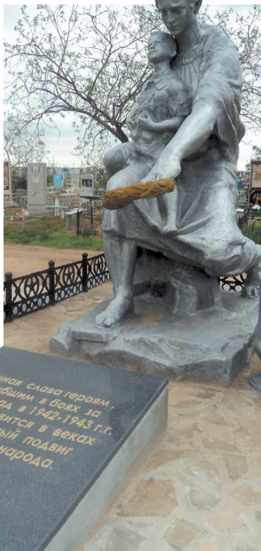
Мемориал Скорбящей матери.

Силами жителей Ленинска, в основном женщин, были построены восемь аэродромов для